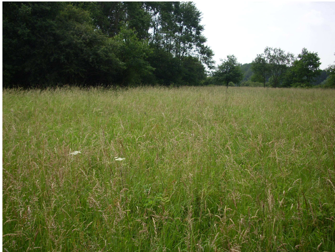
Abb. 4: Versaumter und teilweise verbuschter Borstgrasrasenbestand auf der westlichen Teilfläche.