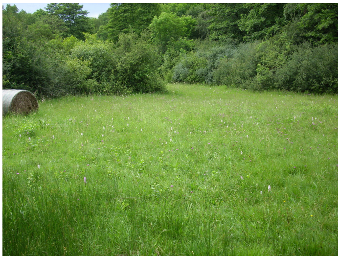
Abb. 3: Hochwertiger Borstgrasrasen auf der östlichen Teilfläche mit Vorkommen von Flohsegge und Massenbestand von Geflecktem Knabenkraut.

Bemerkenswert ist darüber hinaus das Vorkommen von Betonica officinalis , Briza media , Carex caryophyllea , Carex nigra , Carex pulicaris , Dactylorhiza maculata , Dactylorhiza majalis und Epilobium palustre .